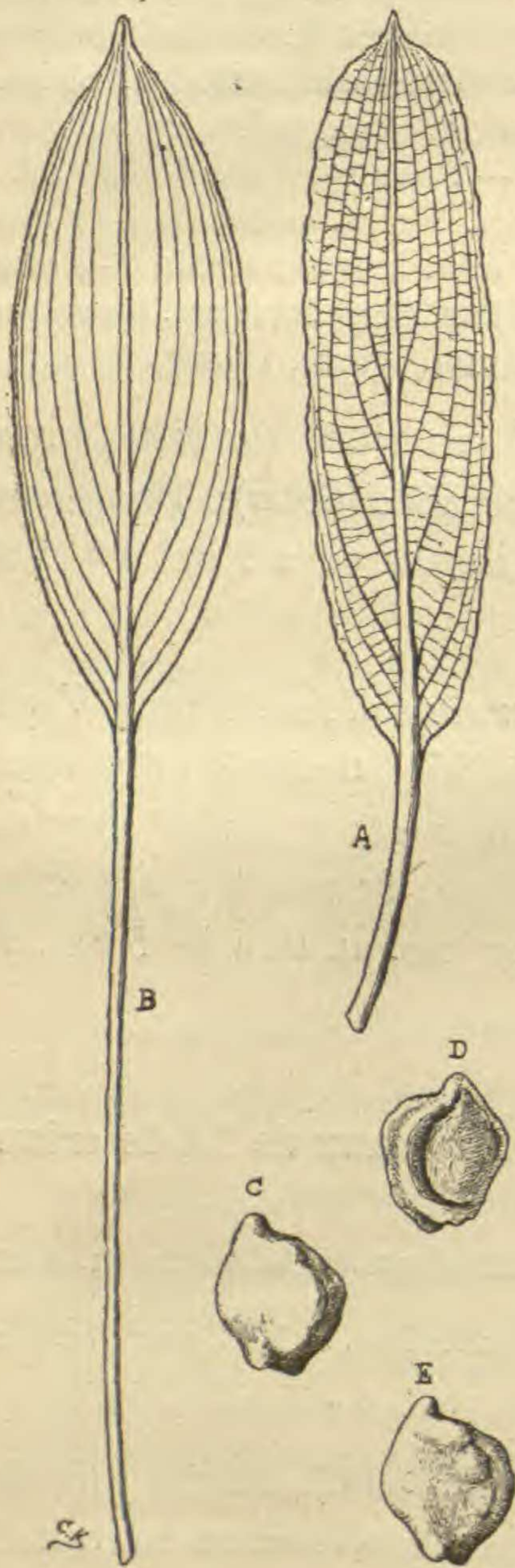
FIG. 2. — Potamogeton tonkinensis A. Camus.

(Bohnhof). Yunnan : environs de Yunnan-sen, dans un étang, 3 juillet 1904, n° 2571 (Ducloux).